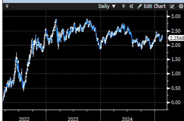
EU 5Y Yield