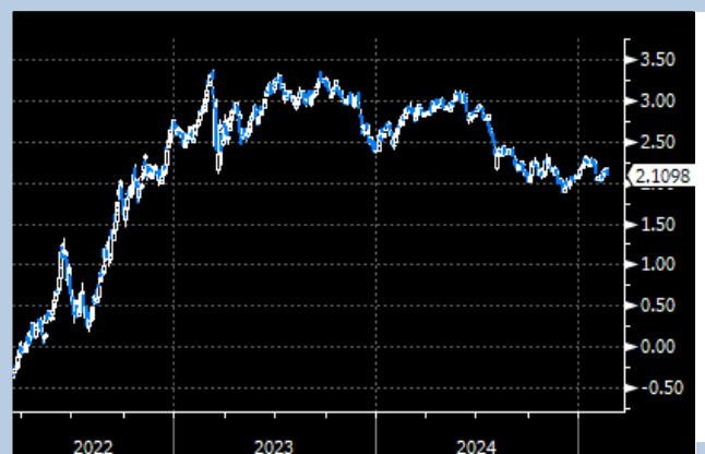
EU 2Y Yield