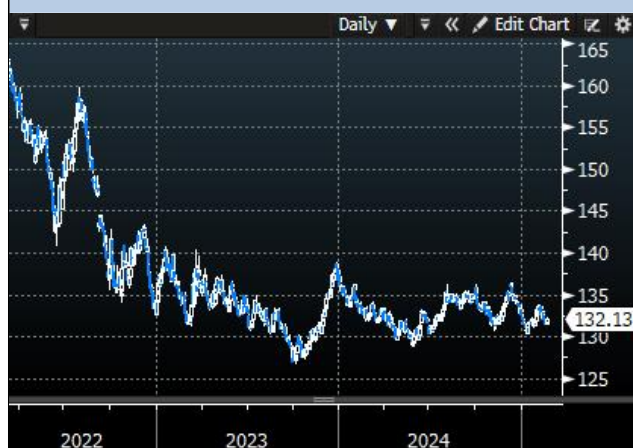
Bund Future Price - 10Y